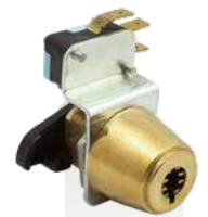
Contacteur en applique 75x75mm